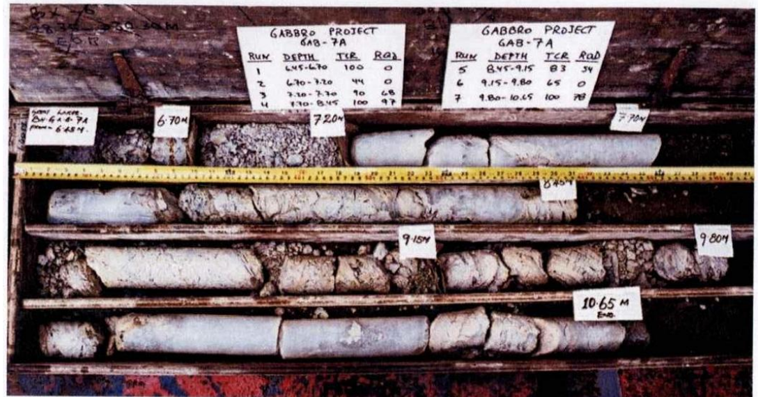
Figura 3.4 – Registro fotográfico de una muestra de roca

etiquetas que acompañan las muestras. Las fotografías deben tomarse en el lugar de muestreo de manera que evidencien el estado de la muestra con la mínima perturbación producido por el manejo posterior. La presencia de conchillas debe mostrarse en las fotos de las muestras individuales. Ver Figura 3.4