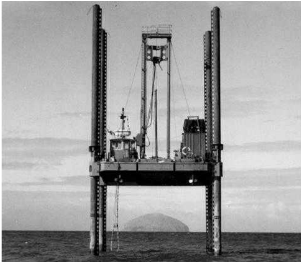
Figura 3.3 – Plataforma tipo Jack-up para realizar perforaciones

En la elección de los sitios donde perforar se utiliza la información ya obtenida mediante otros métodos para realizar la selección de ubicaciones de manera que suministren la información necesaria en los lugares con mayores dudas. Eso se denomina “targeted drilling”