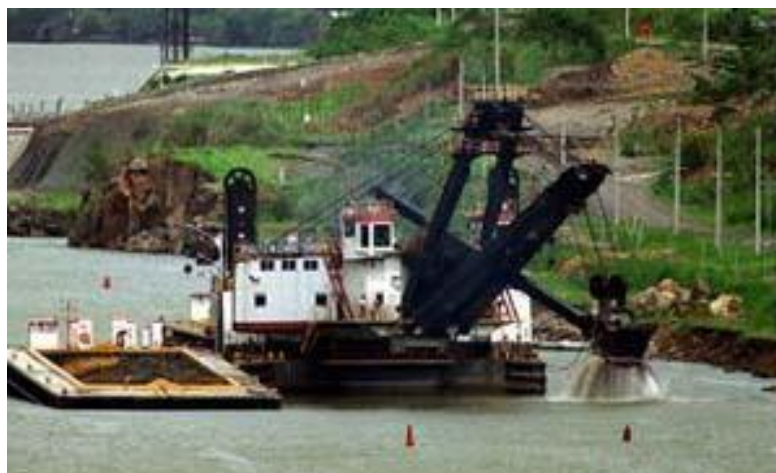
Figura 13.2 – Draga tipo pala (Dipper)

La draga con cables puede operar en áreas con condiciones moderadas de olas gracias a su construcción pesada y a los pilones de anclaje. No es sensible a las bajas profundidades existentes previas al dragado por su capacidad de operar por avance sobre la zona a dragar creando las profundidades necesarias para el avance.